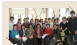
気仙沼美容組合メンバー

新聞記事をみた、震災以前からのお客様から連絡をもらい、久しぶりにお話が出来て本当に良かったと喜んでおります。