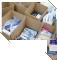
美容支援道具の出荷、同梱作業

現在までに、岩手県、宮城県、福島県の被災された 200 軒以上の美容室へ、約 250 件以上の美容道具・物資を提供致しました。協賛企業やメンバーサロンから届いた支援物資と購入した道具を仕分けし、個別の要望に合わせて発送しています。