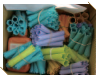
皆さまから届いたロッドやアイロン

■パーマセット ロッド、ペーパー、バンド、クロス、ヘアークリップ、イヤークリップ、ストレートアイロン、カールアイロン、ホットカーラー、タイマー