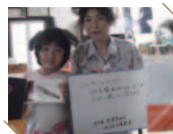
[ 陸前高田市 ] 比佐や美容室

此の度は助かりました。本当にありがとうございました。がれきの中で、やっと店を再開する事が、できました。1日に1軒ずつ解体されて淋しい町になっていますが、生き残ったお客様が、1人2人と来てくださるのは、本当にうれしい事です。