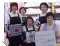
[ 宮古市 ] ことぶき美容室